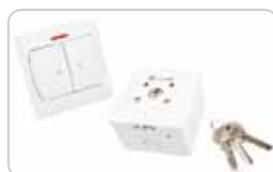
Przełączniki klawiszowe i kluczowe