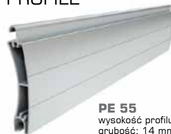
PE 55 wysokość profilu: 55 mm grubość: 14 mm